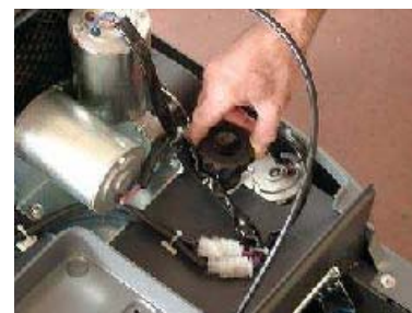
REGOLAZIONE DELLA SPAZZOLA CENTRALE SENZA ATTREZZI