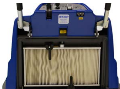
SOSTITUZIONE FILTRI SENZA ATTREZZI