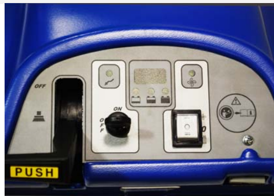
PANNELLO COMANDI DIGITALE