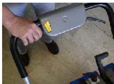
COMANDO DI TRAZIONE E ALZAFLAP