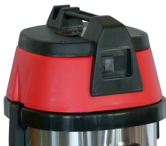
MANICO E PULSANTE ACCENSIONE