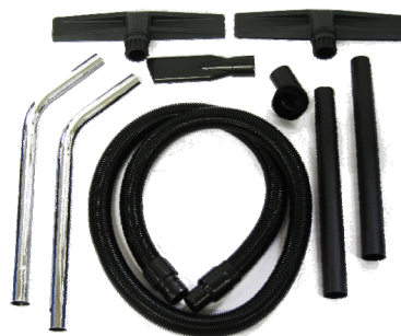
ACCESSORI SERIE 40