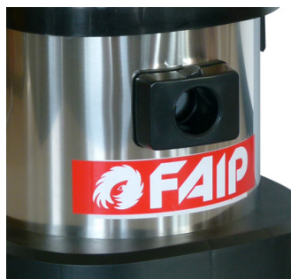
ATTACCO TUBO ASPIRANTE