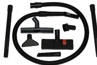
ACCESSORI SERIE 36