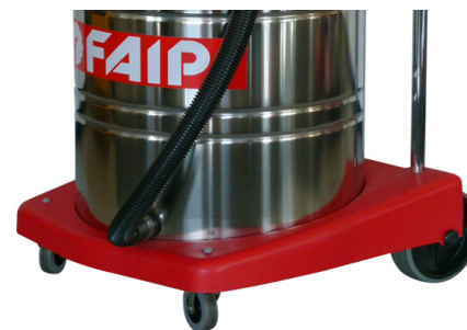
TUBO SCARICO LIQUIDI