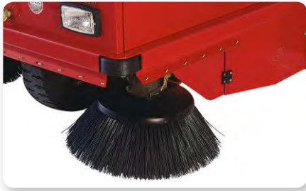
Braccio spazzola laterale Side brush arm Lateral izquierda