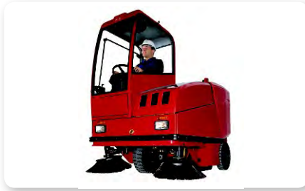
Cabina Cab Cabina