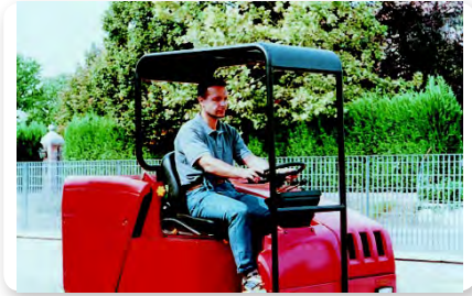
Tettuccio e convogliatore polvere Canopy and dust conveyor Techo y encaminador de polvo