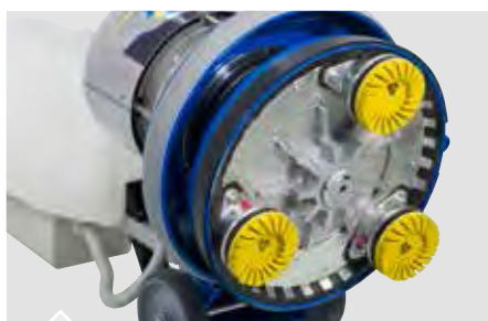
Planetario K1000 incluso