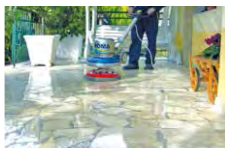
Per una cristallizzazione facile e duratura