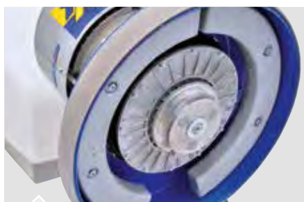
Pesi extra optional