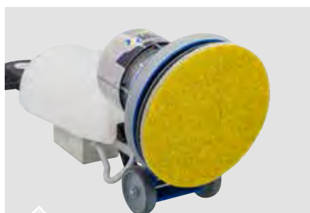
Disponibile con sezione di lavoro da 17"-18"-21"