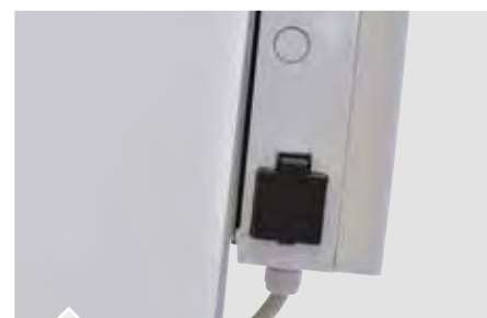
Presa supplementare 220V Inclusa