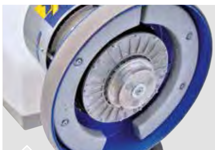
Pesi extra optional