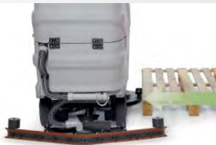
Rientro automatico del basamento in caso di urti accidentali