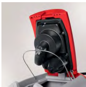
Testata di aspirazione silenziata che garantisce un livello di pressione acustica molto basso consentendo di operare in ambienti dove è richiesta la massima discrezione nelle operazioni di pulizia come case di cura e ospedali senza arrecare disturbo all'ambiente e a chi lo vive