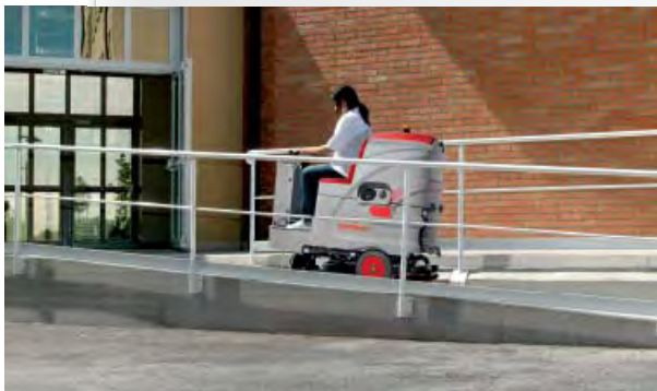
Baricentro basso per un'ottima stabilità. Possibilità di superare le rampe fino al 18%