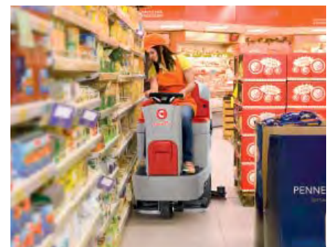
Facile sostituzione delle gomme senza l'utilizzo di utensili sull'esclusivo tergilavaggio Comac (Patent Pending)