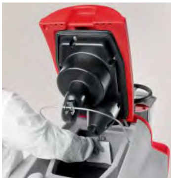
Completa sanificazione dei serbatoi

Facile nella ricarica delle batterie grazie alla possibilità di avere il caricabatterie a bordo (su richiesta)