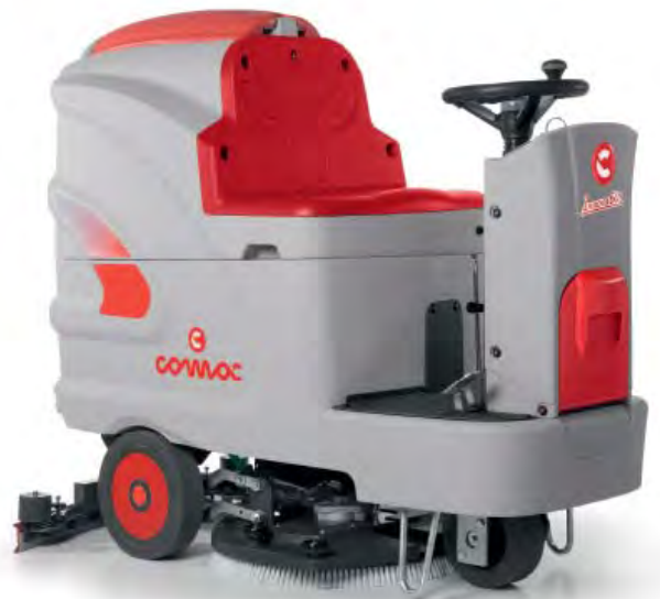
Innova 60 B