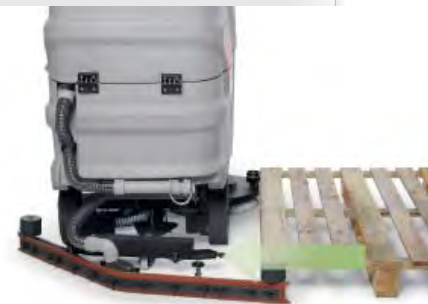
Sgancio automatico del tergipavimento in caso di urti accidentali